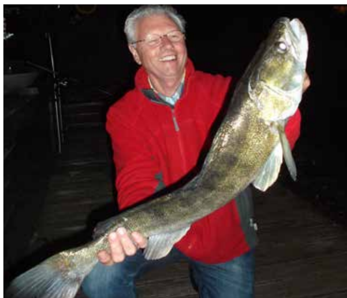
Snoekbaars gevangen met een boilie!