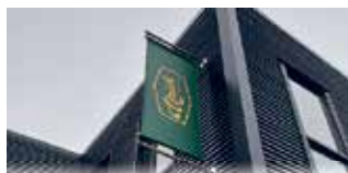
Spandoeken & vlaggen