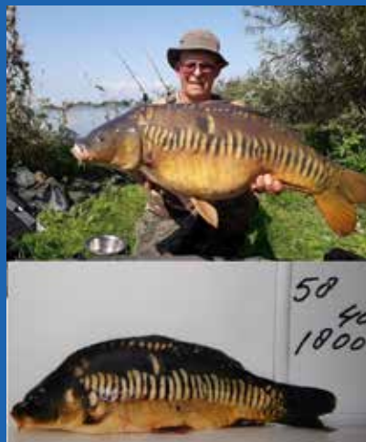
De gematchte HVZ-rijenkarper in 2017 nabij Alkmaar met daaronder de 'plankfoto'

Zoals u ziet op de foto is de spiegelkarper flink gegroeid en heeft al wat kilometers gezwommen. Voor een goede registratie is het belangrijk dat we de vangsten van spiegelkarpers melden bij de vereniging