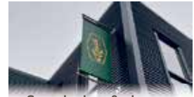
Spandoeken & vlaggen