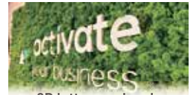
3D letters en logo's